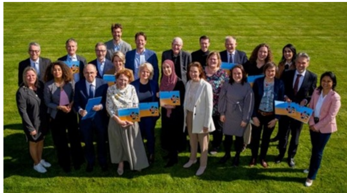
Foto boven: De secretarissen-generaal en de rijkscollega's die de ontwikkelagenda Rijksdienst op 19 april kregen aangeboden.

Op woensdag 19 april presenteerden de secretarissen-generaal de ontwikkelagenda voor de Rijksdienst tijdens een bijeenkomst op het Catshuis. Deze agenda is aangeboden aan collega's die werken bij verschillende onderdelen van de Rijksdienst. Ook de GOR Rijk, in de persoon van de voorzitter, kreeg de ontwikkelagenda, die als titel heeft 'Waardenvol werken voor Nederland' aangeboden en komt binnenkort met een advies aangaande deze agenda.